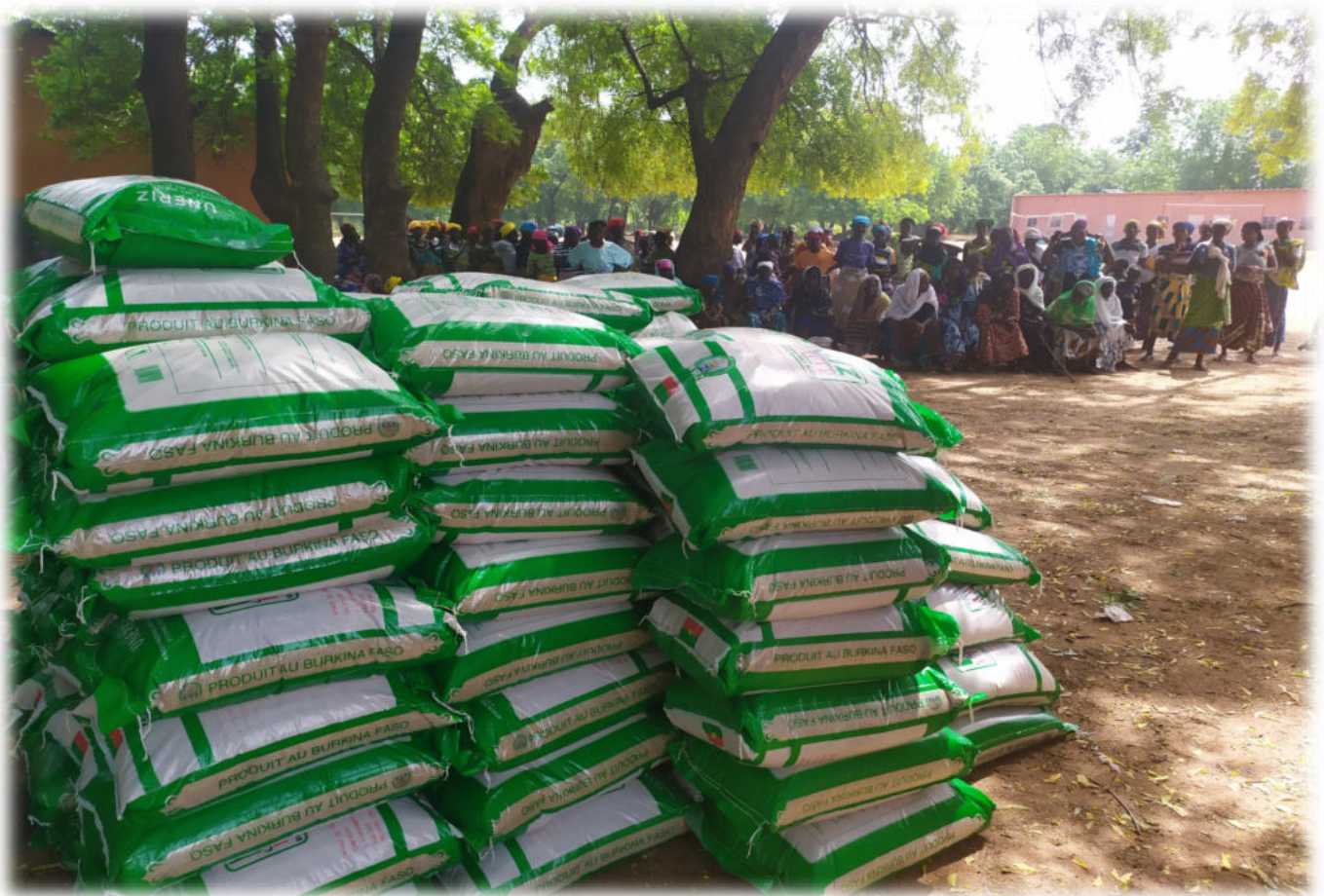
Reisspende an 257 Wittwen in Kotedougou