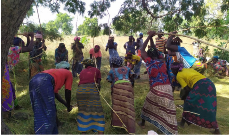
Reisdreschen von Hand, mit Hilfe von Holzkeulen