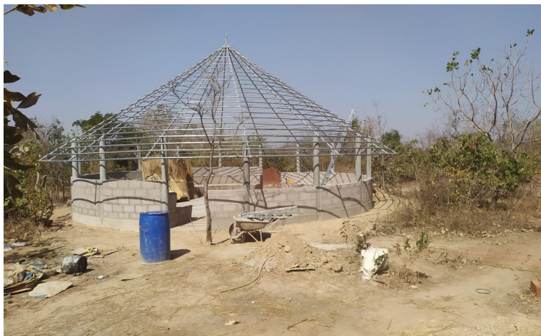
Le chantier mis à l'arrêt pour les fête de fin d'année