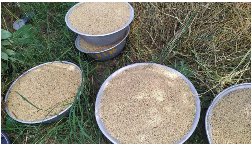
Battage du riz pour détacher les grains de leur épi ce fait manuellement avec des battons .