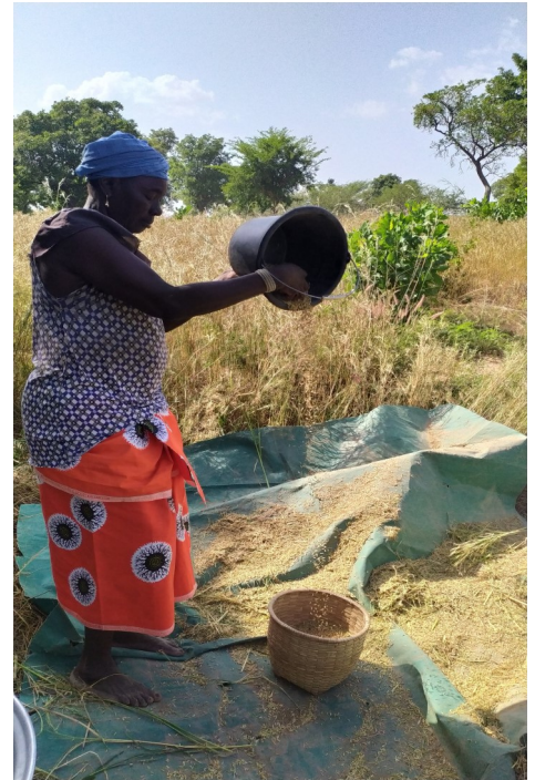
Vannage , séparation du riz de la peau de riz.