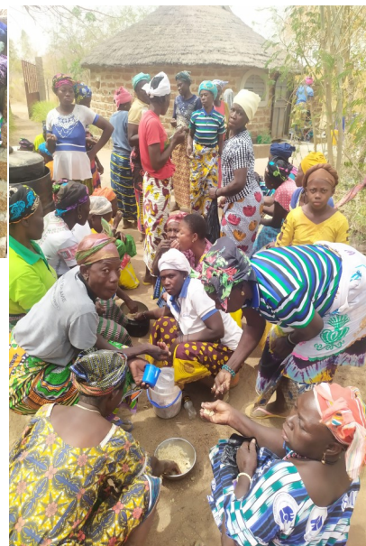
Réunion sous le hangar de la caravan, un peu serré...avec enseignement sur le Coeur de l'homme" . A midi il y a toujours un plat de riz pour les femmes et les enfants.