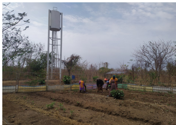
Les femmes sont en train de récolter les feuilles d'oseilles et feuilles d'haricots, nous avons pu aussi récolter de la bonne salade.