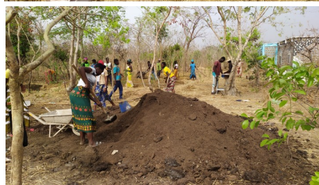
30 élèves de l'école d'agriculture et entrepreneuriat de l'église Presbyterienne suivent un stage pratique en permaculture au Wëndbenedo-Ranch 2 matinées par semaine pour renforcer leurs capacités en pratiques alternatives en complément de leur formation conventionnelle