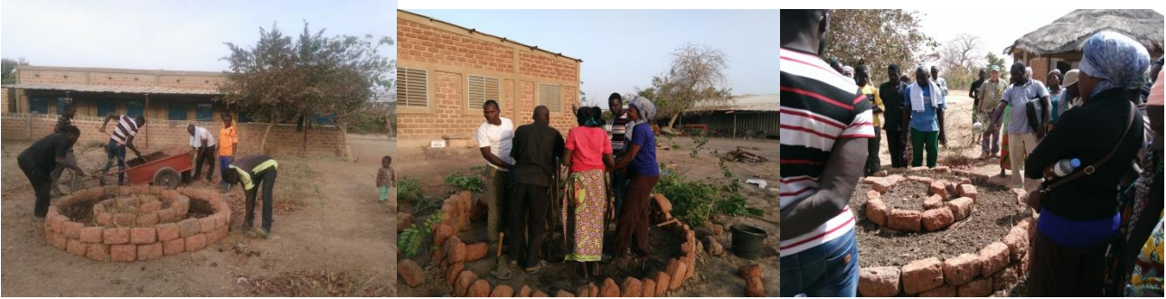
Praktische Arbeiten wie Kräuterspirale und Küchengarten