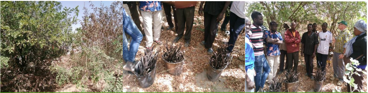
Sammeln von den Samen : « cassia sibérian » mit den Kursteilnehmern , Realisation von einer Baumschule