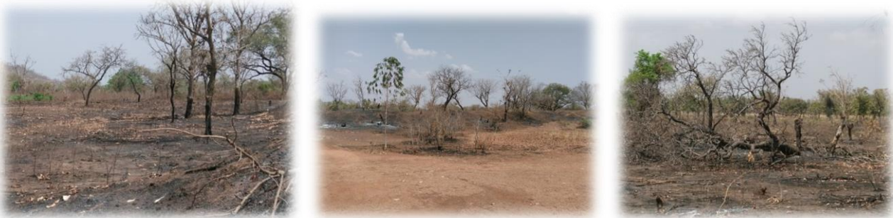
Ständige Gefahr von Buschfeuer : ob wegen einer Ratte die veräst wird oder aus Ignoranz. auf jeden Fall gefährlich