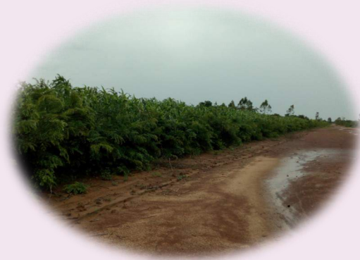
Haie vive d'un bocage Sahélien