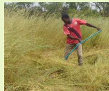
Le travail de rétention des eau de pluies et les cendres ont favorisé l'augmentation de la biomasse.