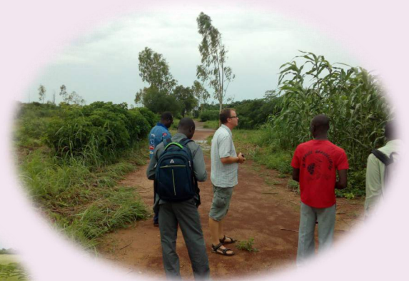
Les tiges de mils vigoureux dans des trous de ZAï