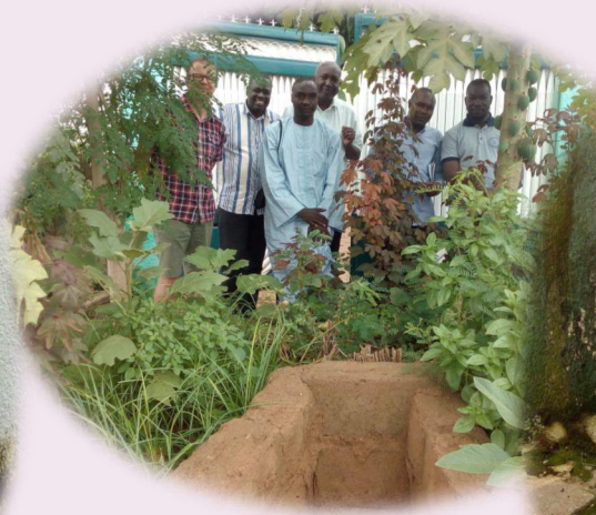
conservateur de produits frais.