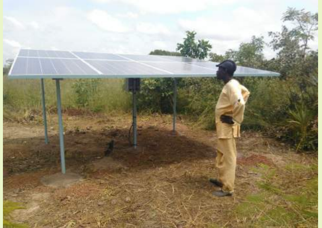
SOURCE D'ÉNERGIE SOLAIRE POUR LA POMPE