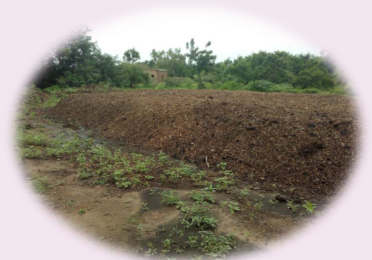
Composte à partir du BRF (bois raméal fragmenté)