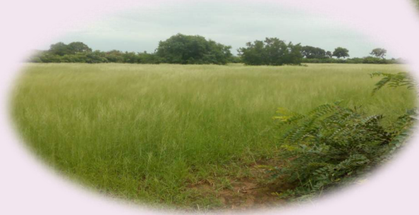
Grande prairie dans le bocage.