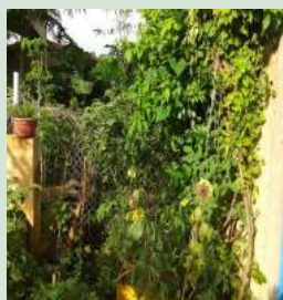
Jardin nourricier FOOD FOREST