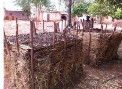
Le champion du compostage.