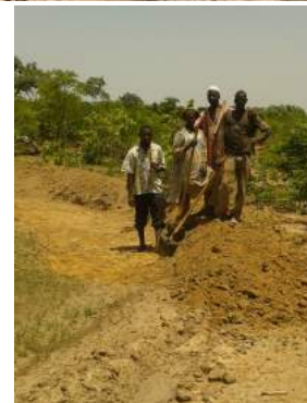
Les courageux délégués apprenants représentant leur communauté