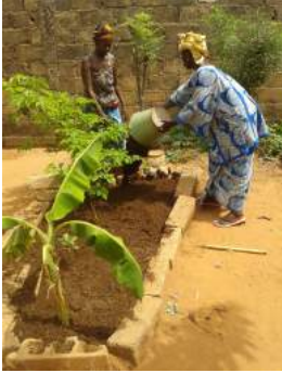
Agriculture urbaine avec les femmes