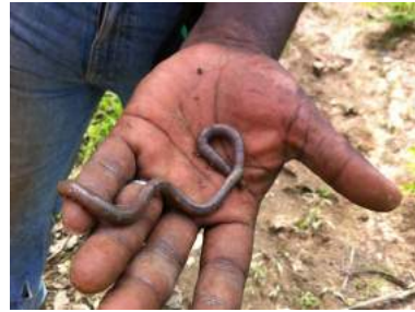
Les laboureurs vivants. Même pas besoin de tracteurs.