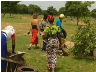
Nettoyage plusieurs mois après l'incendie durant la saison sèche. Et reprise des activités de clôture de la ferme après l'incendie.

A gauche eau de l'étang image au-dessus.