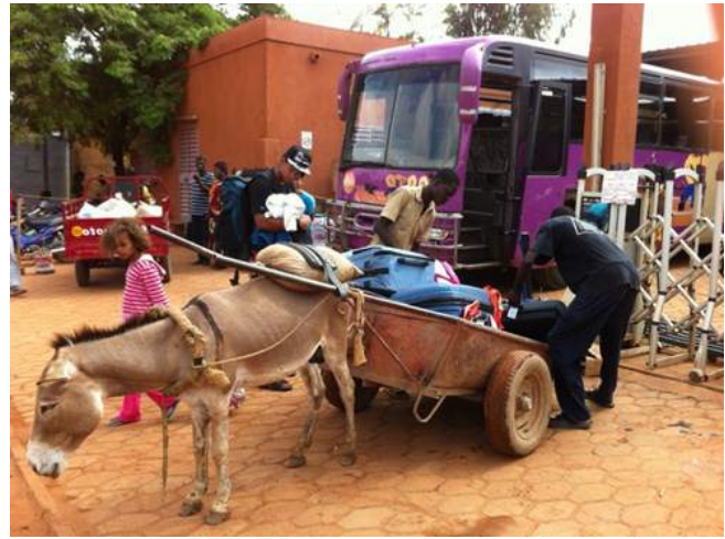
Arrivée à Ouagadougou et départ pour Bobo-Dioulasso