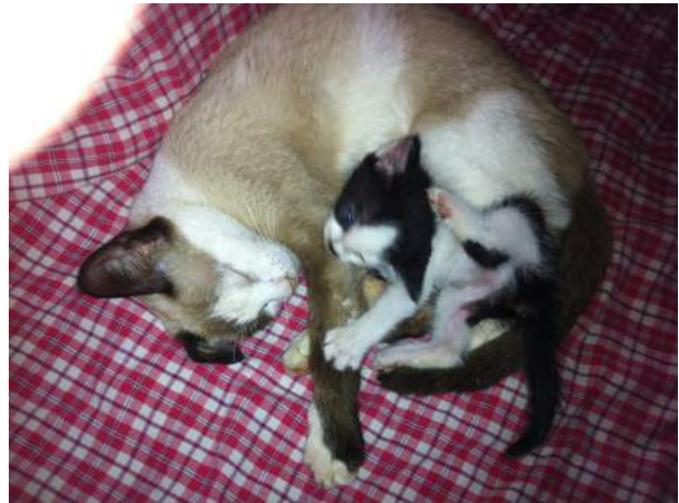
Un petit chaton est né pendant notre absence