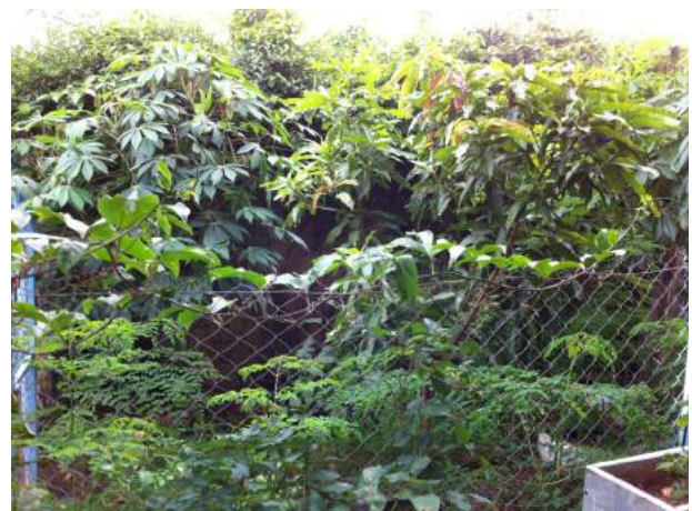
Le jungle dans notre jardin