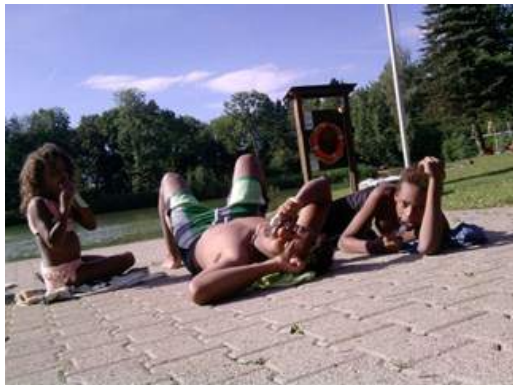
L'eau, le soleil et une cure de repas Suisse qui manquent à Bobo.