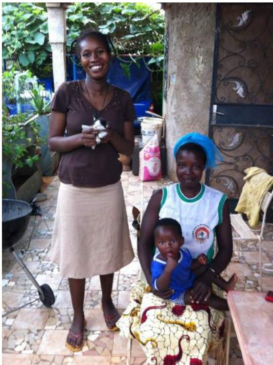
Nos nièces qui ont gardées notre maison et animaux pendant les 10 semaines.