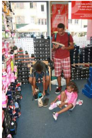
À la chaise des chaussures sans trou....