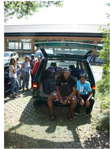
La Peugeot verte prêtée notre compagnons de route qui nous a permis d'aller partout.