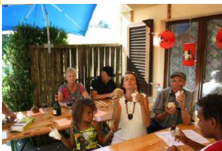
Fête du 1 er août à Appenzell et à Gais, fête de 500 ans de AI et AR