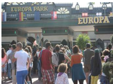
Le rêve des enfants c'est réalisé: nous sommes allés en Suisse pour les vacances et à Europapark!!!